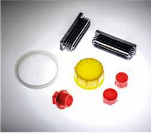
TAPPI ED INSERTI IN PLASTICA