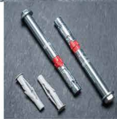
TASSELLI E ANCORANTI