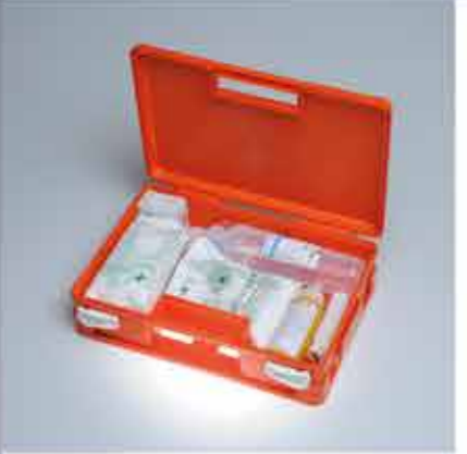
DISPOSITIVI DI PROTEZIONE INDIVIDUALI