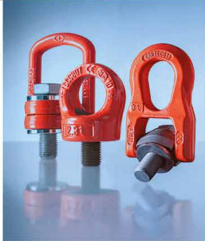
GOLFARI GIREVOLI DISPOSITIVI DI SOLLEVAMENTO DISPOSITIVI DI ANCORAGGIO E ARRESTO ANTICADUTA