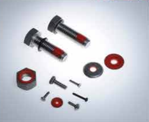
BULLONI, VITI, DADI E RONDELLE A TENUTA STAGNA